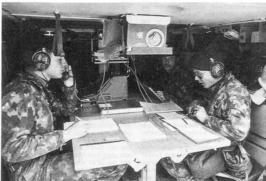
Mit Hilfe des FARGO-Rechners werden auf der Batterie-Feuerleitstelle die Schiessselemente berechnet.

Den Schritt ins Zeitalter der gepanzerten oder mechanisierten Artillerie unternahm unsere Armee Anfang der 70er Jahre mit der Beschaffung der 15,5-cm-Panzerhaubitzen. Seither verfügen wir über ein Mittel zur rascheren und wirksameren artilleristischen Feuerunterstützung, und bis 1992 wird das Gros der mobilen Artillerie mit diesem System ausgerüstet sein. Die selbstfahrenden Geschütze vermögen anderen mechanisierten Verbänden zu folgen und sind dank ihrer Beweglichkeit in der Lage, dem gegnerischen Feuer auszuweichen. Ihre Panzerung schützt die Geschützbedienungen gegen die Geschosse der Infanterie sowie Splitter schwerer Waffen. Verbunden mit ihrer Schussweite von 17 km, dem Kaliber 15,5 cm und einer Feuerkadenz von sechs Schuss pro Minute vermag damit die Panzerhaubitze den heutigen Forderungen nach rascher Feuerbereitschaft und hoher Feuerkraft zu genügen.