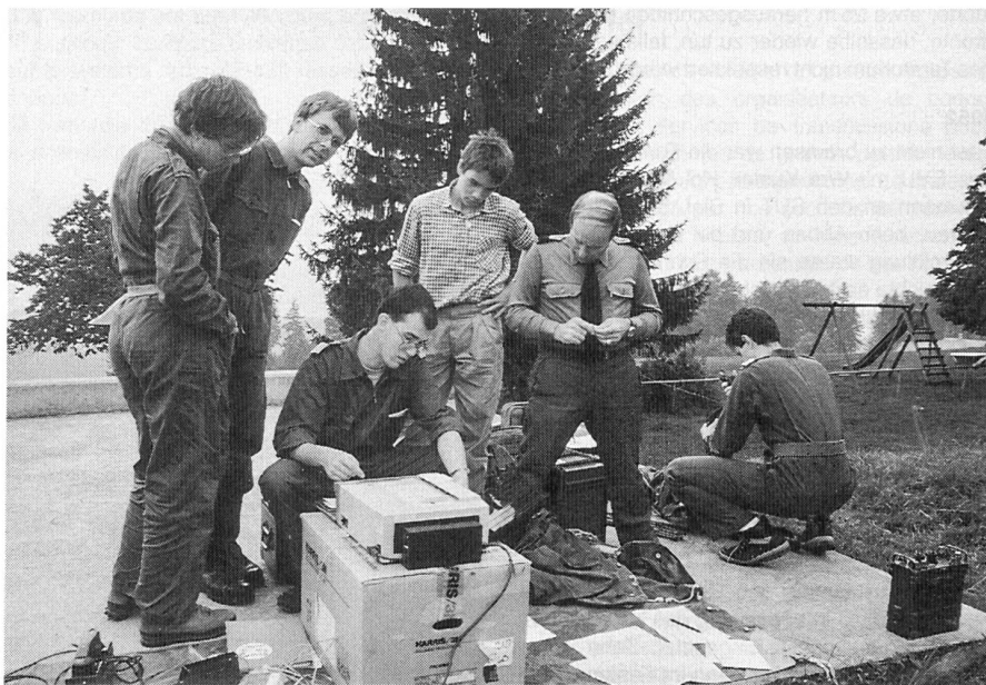
Grosses Interesse am Telefax, Übung «Quintett» 1989.

In St.Gallen stellen wir das Lehrpersonal für derzeit 3 Klassen der vordienstlichen Kurse. Dort werben wir auch regelmässig um unsern Nachwuchs an Jungmitgliedern.