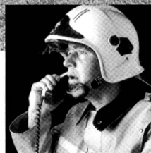
Mehrfachnutzung der Telefonleitung.

Was passiert, wenn etwas passiert? Wenn plötzlich aus einer eher harmlos aussehenden Situation ein Ernstfall wird? Dann ist ein reibungsloser Ablauf von Alarmierung und Mobilisation nötig. Das Zusammenspiel der Kräfte darf keine Lücken haben. Denn: Wenn es mit der Koordination zwischen Alarm und Mobilisation nicht klappt, wenn sich Verständigungsfehler einschleichen oder die Kommunikationswege überlastet sind, dann kann es kritisch werden. Deshalb ist nur eine Gesamtlösung der richtige Weg. Im übrigen auch der wirtschaftlichste! Ascom Autophon AG hat im Bereich Alarm und Mobilisation eine breite Erfahrung anzubieten. Mit Systemen, die sich im harten Einsatz bewähren.