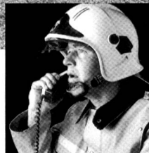
Mehrfachnutzung der Telefonleitung.

Was passiert, wenn etwas passiert? Wenn plötzlich aus einer eher harmlos aussehenden Situation ein Ernstfall wird? Dann ist ein reibungsloser Ablauf von Alarmierung und Mobilisation nötig. Das Zusammenspiel der Kräfte darf keine Lücken haben. Denn: Wenn es mit der Koordination zwischen Alarm und Mobilisation nicht klappt, wenn sich Verständigungsfehler einschleichen oder die Kommunikationswege überlastet sind, dann kann es kritisch werden. Deshalb ist nur eine Gesamtlösung der richtige Weg. Im übrigen auch der wirtschaftlichste! Ascom Autophon AG hat im Bereich Alarm und Mobilisation eine breite Erfahrung anzubieten. Mit Systemen, die sich im harten Einsatz bewähren.