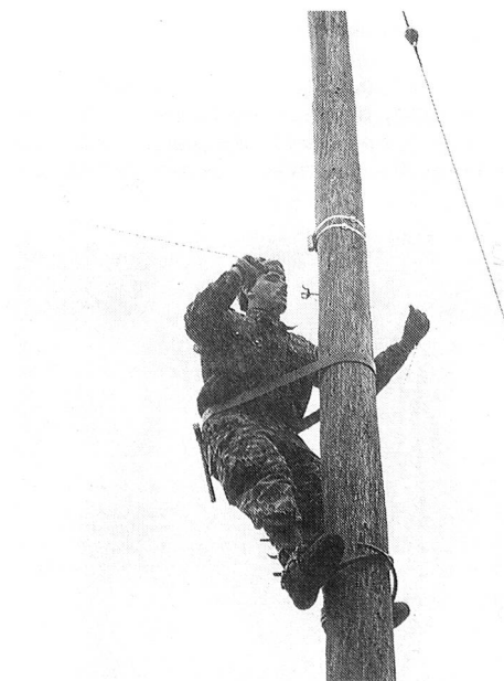
La construction de lignes dans une région fortement bâtie exige des connaissances techniques étendues et beaucoup d'entraînement.

La construction des lignes est assurée normalement par des groupes de construction à pied. Selon les priorités, les différentes compagnies peuvent être renforcées par les moyens mobiles de la compagnie d'état-major du régiment de soutien. Les membres du service des transmissions font partie des spécialistes indispensables. Ils portent avec fierté l'éclair à leur col!