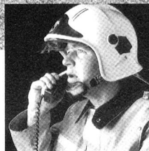
Mehrfachnutzung der Telefonleitung.

Was passiert, wenn etwas passiert? Wenn plötzlich aus einer eher harmlos aussehenden Situation ein Ernstfall wird? Dann ist ein reibungsloser Ablauf von Alarmierung und Mobilisation nötig. Das Zusammenspiel der Kräfte darf keine Lücken haben. Denn: Wenn es mit der Koordination zwischen Alarm und Mobilisation nicht klappt, wenn sich Verständigungsfehler einschleichen oder die Kommunikationswege überlastet sind, dann kann es kritisch werden. Deshalb ist nur eine Gesamtlösung der richtige Weg. Im übrigen auch der wirtschaftlichste! Ascom Autophon AG hat im Bereich Alarm und Mobilisation eine breite Erfahrung anzubieten. Mit Systemen, die sich im harten Einsatz bewähren.