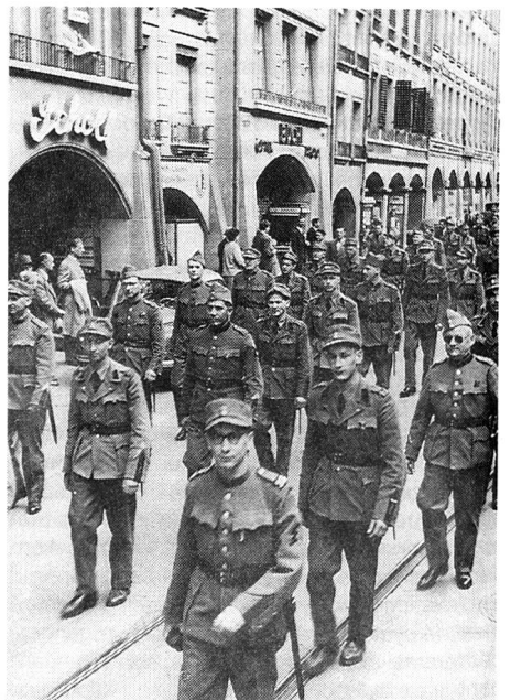
Ein Teil der Sektion beider Basel am 25. Jubiläum in Bern 1952.

Unsere Sektion zählte nun – nach dem Zweiten Weltkrieg – bereits bald 20 Jahre, ging also der «Volljährigkeit» entgegen. Wie viel gab es über die «Jugend» zu schreiben! Und jetzt... bzw. dann...? Die geruhsamen Jahre kamen. Der Verein war konsolidiert und in eine Zeit hineingewachsen, da sachlich und fachlich gearbeitet werden konnte. So nahmen auch wir teil an alljährlichen Übermittlungsübungen, fachtechnischen Kursen aller Art sowie am permanenten Übungsnetz, solange wir unser Pi-Haus benutzen konnten.