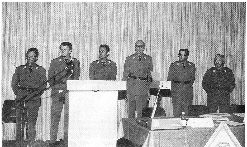
Le nouveau président central (2e depuis la gauche) avec le comité sortant.

Über die anlässlich der Hauptversammlung behandelten Geschäfte wird zu gegebener Zeit im Protokoll berichtet.