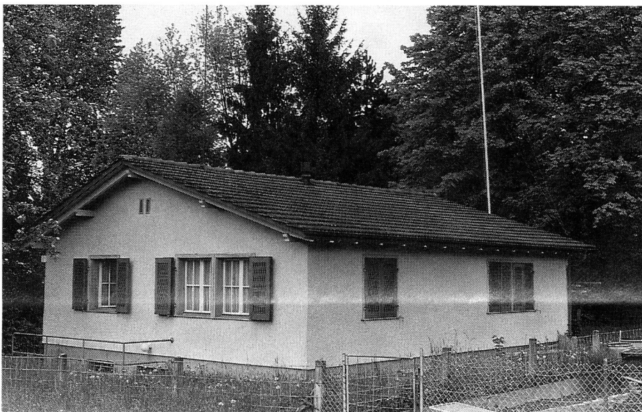
EVU-Eigenheim nahe dem Tierpark in Langenthal.

Die EVU-Sektion Langenthal ist zugleich Sektion des Unteroffiziersvereins (UOV) Langenthal. Momentan sind 10 Aktivmitglieder eingetragen.