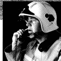
Mehrfachnutzung der Telefonleitung.

Was passiert, wenn etwas passiert? Wenn plötzlich aus einer eher harmlos aussehenden Situation ein Ernstfall wird? Dann ist ein reibungsloser Ablauf von Alarmierung und Mobilisation nötig. Das Zusammenspiel der Kräfte darf keine Lücken haben. Denn: Wenn es mit der Koordination zwischen Alarm und Mobilisation nicht klappt; wenn sich Verständigungsfehler einschleichen oder die Kommunikationswege überlastet sind, dann kann es kritisch werden. Deshalb ist nur eine Gesamtlösung der richtige Weg. Im übrigen auch der wirtschaftlichste! Ascom Autophon AG hat im Bereich Alarm und Mobilisation eine breite Erfahrung anzubieten. Mit Systemen, die sich im harten Einsatz bewähren.