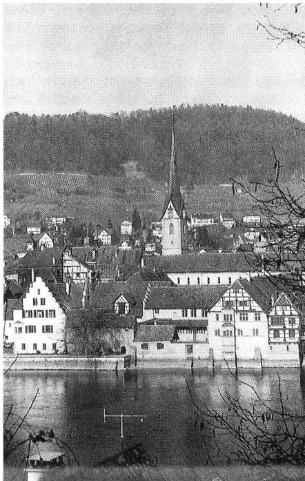
Schmuckes Städtchen: Stein am Rhein.

Andreas Beutel Präsident Sektion Schaffhausen