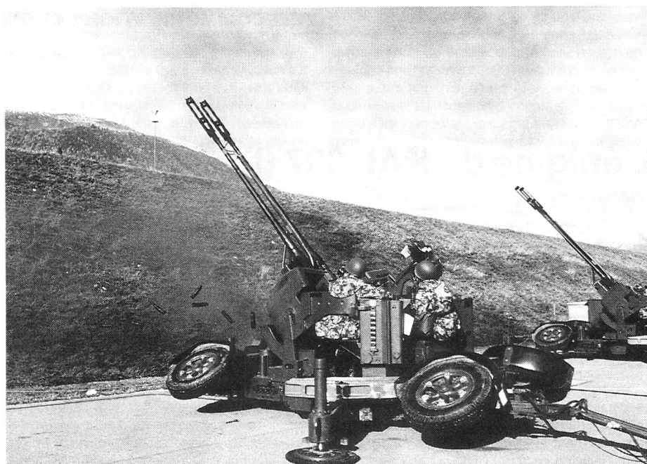
Auf den Schiessplätzen zeigt sich die Qualität der Vorbereitungen.

Das ganze System wird durch vier Mann be- dient. Dabei übernimmt ein Offizier oder Unter- offizier die Feuerleitung, ein Soldat die Radar- erfassung und ein weiterer die Zielverfolgung mit dem Radar oder dem optischen System. Ein dritter Radarsoldat ist für optische Zielzuwei- sung ausserhalb des Gerätes zuständig.