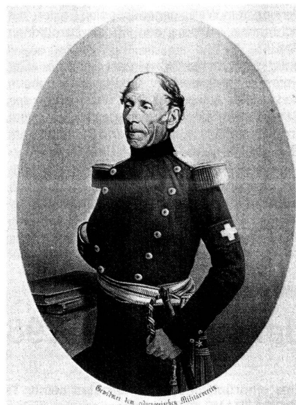
Le général Dufour. Gravure de Perron (Musée militaire de Colombier).