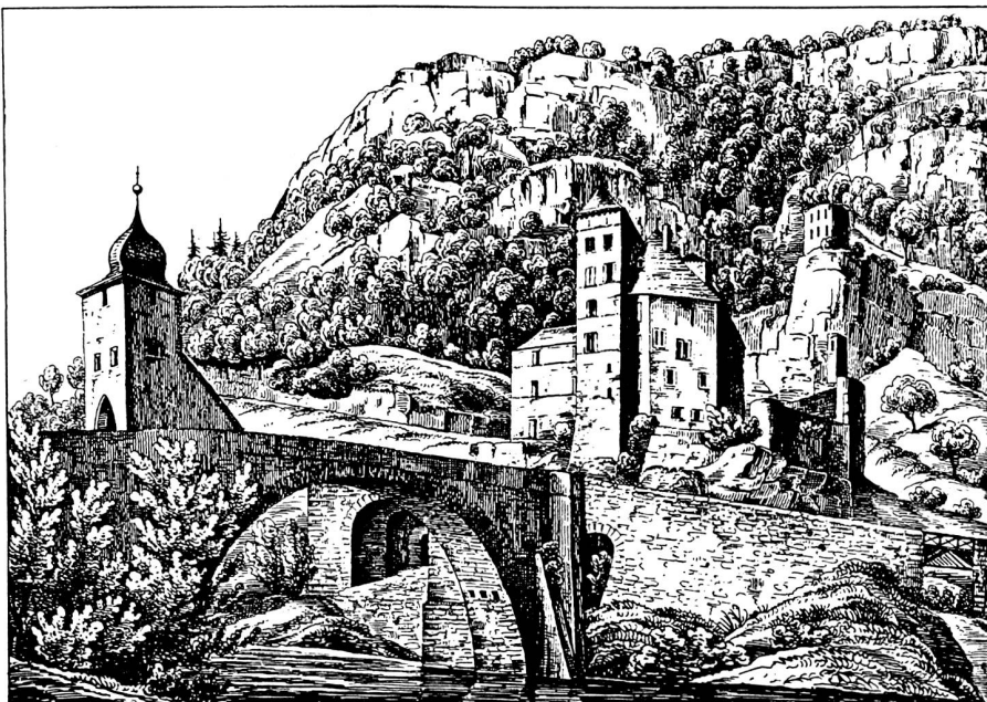
Gravure anonyme: Le pont de Saint-Maurice entre 1831 et 1847. Association du Vieux Saint-Maurice.

Unter der Nummer 35 ist in der Serie der «Cahiers d'archéologie romande» im vergangenen Herbst zum Anlass des 200. Geburtstags des Generals ein hervorragend gestaltetes Werk erschienen. Das reich illustrierte Buch mit dem Titel «Le Général Dufour et St-Maurice» verdanken wir der Zusammenarbeit folgender Stellen: Bibliothèque historique vaudoise, Direction