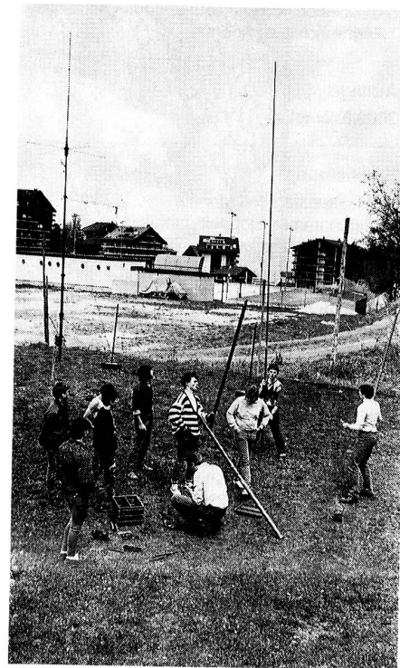
Montage d'antennes lors d'une sortie à Haute-Nendaz.

La première grande sortie de la section s'est effectuée à Lausanne lors de l'exercice national Romatrans. Ce fut pour chacun de nos partici-