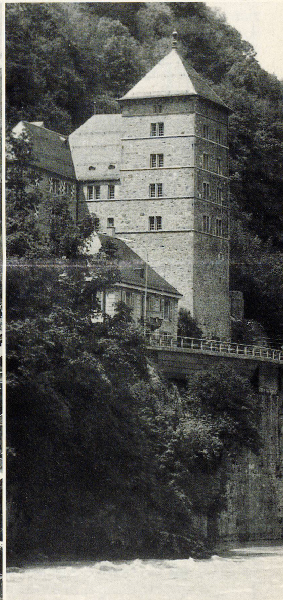
Le château de Saint-Maurice qui abrite le musée militaire