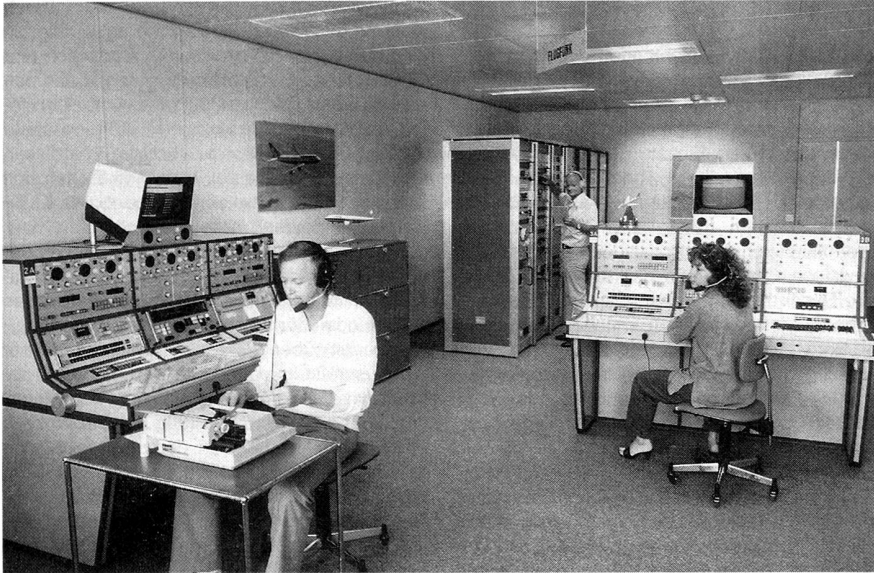
«BERNA-RADIO»: Kurzwellen-Flugfunk-Bodenstation der Radio-Schweiz AG (ab 1.1.88 Integration in die PTT!) Schweiz. Gegenstation für die SKH-Übermittlungen.