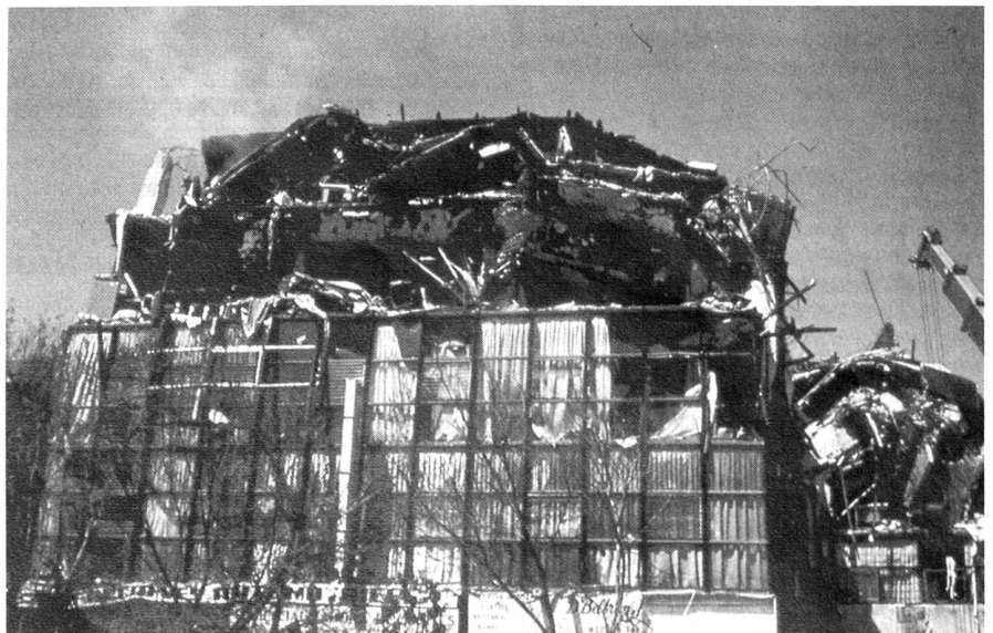
Erdbebenkatastrophe Mexiko 1985.

schen und betrieblichen Voraussetzungen die Verbindungen nur in Morsetelegrafie erfolgen konnten. Für den Einsatz in solchen Netzen waren deshalb versierte Operateure notwendig, welche in der Lage sein mussten, Telegramme mit mindestens 80–100 Zeichen pro Minute zuverlässig und auch unter misslichen Übertragungsbedingungen zu senden. Die Anzahl verfügbarer Berufstelegrafisten für derartige Einsätze war jedoch in der Schweiz schon in den siebziger Jahren begrenzt und hat heute noch weiter abgenommen. Sie rekrutierten sich überwiegend aus Beständen der ehemaligen RADIO SCHWEIZ AG oder aus ehemaligen Schiffsfunkern. Ein weiteres Problem bildete die Gegenstation in der Schweiz. Das Korps war aus verschiedenen Gründen nicht in der Lage, selber eine grössere, leistungsfähige Kurzwellen-Funkstation zu betreiben und musste deshalb provisorisch auf die Anlagen anderer Organisationen zurückgreifen, was den Informationsfluss kaum verbesserte.