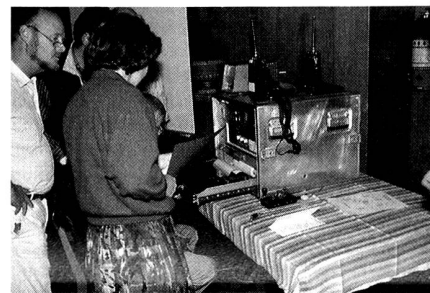
Wiederholungskurse für die Freiwilligen der Übermittlungsabteilung.

schen Entwicklung etwas verlagert. Waren einst profunde Morsekenntnisse notwendig, so sind heute eher Kenntnisse der Computer- und Digitaltechnik gefragt. Der Umgang mit den modernen Übermittlungsmitteln erfordert einen relativ hohen Ausbildungs- und Erfahrungsstand im Umgang mit neuester Technik. Aus diesen Gründen drängt sich der vermehrte Einsatz von lizenzierten Kurzwellen-Amateurfunkern im Korps auf, die dank ihren praktischen Erfahrungen und des dauernden Trainings an ihren privaten Stationen auch in der Lage sind, im Feld Einsatz leistungsfähige Antennen zu bauen und auftretende Störungen zu beheben. Sie verfügen zudem über praktische Erfahrungen über die Ausbreitung von Kurzwellen, was bei der Frequenzoptimierung insbesondere für Weiterverbindungen von Bedeutung ist. Neben dem individuellen Training an der privaten Station hat der Freiwillige der Übermittlungsabteilung die Möglichkeit, jedes Jahr an einem Wiederholungskurs teilzunehmen. Zur Erweiterung dieser Trainingsmöglichkeiten wird ein Teil der Kompaktstationen in der Schweiz dezentral aufbewahrt; sie dienen dem Betrieb eines Übungsnetzes, das die Freiwilligen unter Aufsicht fachkundiger Leiter in kürzeren Zeitabständen benützen können.