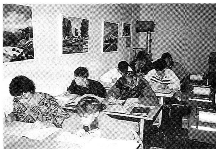
Die Kursteilnehmer bei der Prüfung über den Starkstrombefehl.

Zurzeit steht der Starkstrombefehl auf dem Kursprogramm. Dabei geht es darum, dass jeder angehende Übermittlungspionier eine Leitung anhand der Masten identifizieren kann und weiss, ob und wie er in der Nähe solcher Leitungen Truppenleitungen bauen darf. Ebenfalls muss er auch Auskunft geben können, wie hoch die Spannungen dieser Leitungen sind. Im weiteren geht es darum, was zu tun ist bei einem Starkstromunfall.