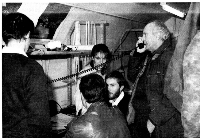
tutto funziona bene.