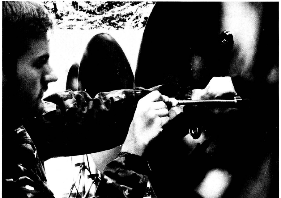
Point concentration R-902 à la piscine Bellevaux