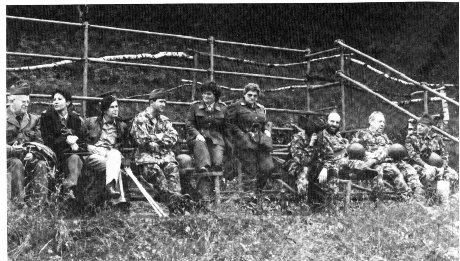
Si controlla e si osserva