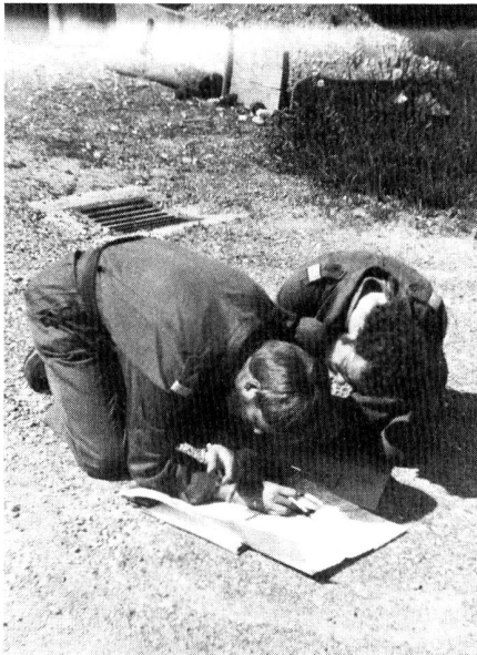
Genauere Kartenarbeit: «do mues doch neimäd ä Beiz siil!»

mundenden Mittagessen wurde nochmals versucht, die beiden R-902 Stationen ausfindig zu machen. Infolge starken Wetterumschwunges musste aber nach geraumer Zeit abgebrochen werden, womit eine interessante Übung zu Ende ging. Unseren speziellen Dank richten wir an die Übungsleitung der Sektion Thurgau, die hier sicher einiges ihres Könnens unter Beweis gestellt hat.