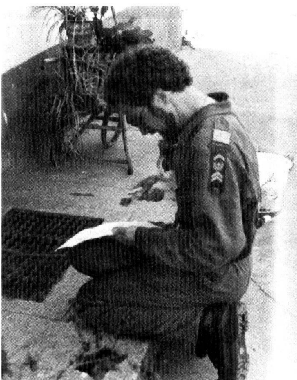
Na los – Pfote her!

mundenden Mittagessen wurde nochmals versucht, die beiden R-902 Stationen ausfindig zu machen. Infolge starken Wetterumschwunges musste aber nach geraumer Zeit abgebrochen werden, womit eine interessante Übung zu Ende ging. Unseren speziellen Dank richten wir an die Übungsleitung der Sektion Thurgau, die hier sicher einiges ihres Könnens unter Beweis gestellt hat.