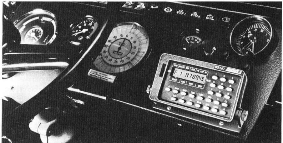
Bild 6 In einem Bus eingebaut, dient hier das Bediengerät BG 560 zur Übermittlung von Fahrzeug- und Verkehrsdaten an die Leitstelle.

Der Anwender erhält mit den neuen Geräten Kommunikationsmittel, mit denen er einfacher «funken» sowie seine bisherigen Anforderungen abdecken kann und sich den Weg in die «Funkzukunft» nicht verbaut.