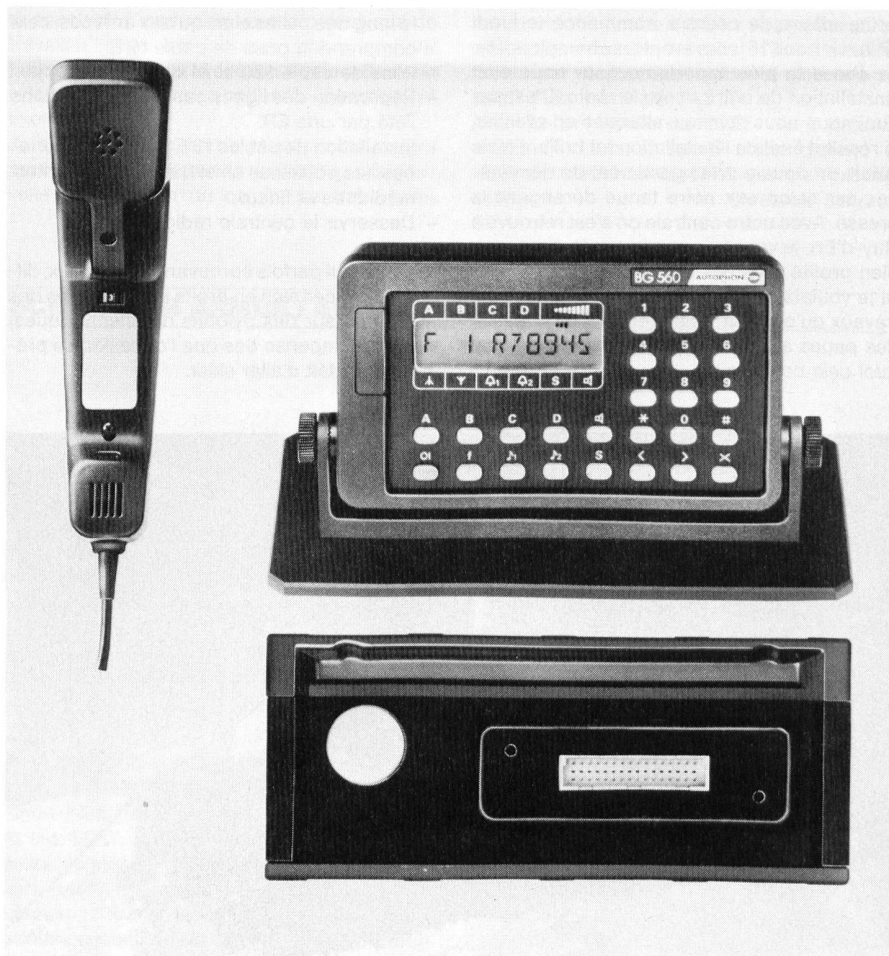
Die drei Teile des SE 560: Der Sender-Empfänger (unten), der abgesetzt über das Bediengerät BG 560 betrieben wird, und das Mikrotel (links).

Erweiterte Ausführungen dieses SE-Teiles enthalten auch die Duplex-Weiche und gegebenenfalls einen zweiten Empfänger.