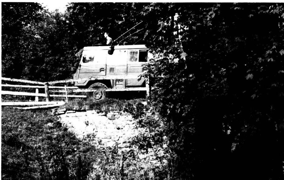
Crédo de la section Uzwil

Musique classique, lecture, voyages, vie associative