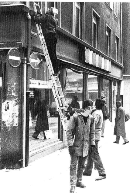
Leitungsbau für die Übung PEGASUS mitten in der Innenstadt von St. Gallen. Die Funkerkursschüler lernten so die Stadt auch von einer anderen Seite kennen.

Die grosse Teilnehmerschar versammelte sich um 8 Uhr bei einigen Minusgraden und nahm einen Lastwagen voll Material in Empfang, den Herr Frei vom Zeughaus eigenhändig steuerte. Mit einem Pinzgauer wurde nun ein Teil davon auf die Aussenstationen verteilt, damit sich auch dort die kalten Finger beim Aufbauen wieder etwas erwärmen konnten. Es verwundert wohl nicht, dass unter diesen klimatischen Bedingungen und mit den mehrheitlich unerfahrenen Teilnehmern die Betriebsbereitschaftszeit