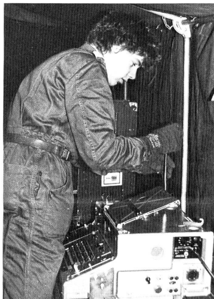
Auch bei eisiger Kälte bringt ein EVUler einen KFF zum Laufen. Die Übung PEGASUS darf trotz der eher misslichen Wetterverhältnisse als Erfolg gewertet werden.

Das Wetter war uns an diesem Tag nicht eben wohlgesinnt. In der Stadt bewegten sich nur halb so viele Leute wie sonst an Samstagen üblich. Die Suppe und die Käseküchlein wurden zunächst nur schleppend abgesetzt. Vielen Leuten war es schlicht zu kalt, um ihre Aufmerksamkeit länger als ein paar Minuten dem militärischen Treiben zu widmen. Erst als zum Rückzug geblasen wurde, war die Kälte etwas gewichen, und die Suppentöpfe wurden schliesslich doch noch leergegessen.