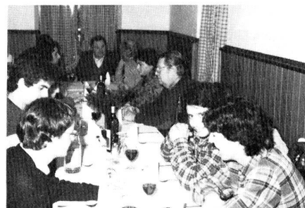
Da 15-60 una bella famiglia.