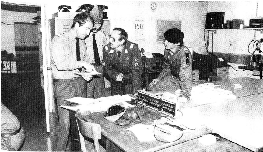
GIGARO 85: Sektions- und Gesamtübungsleitung besprechen die Lage.