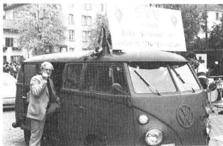
Unsere mobile Lautsprecheranlage.

Ferner musste wieder die Lautsprecheranlage aufgebaut werden, und zwar zuerst am Start und später im Zielgelände. Um dieses mobile Lautsprecherzentrum hat sich einmal mehr Hermann Portmann gekümmert.