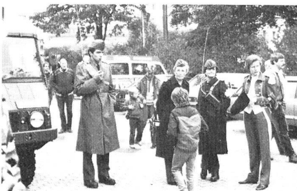
Zwei Netzleitstationen im Zielgelände.