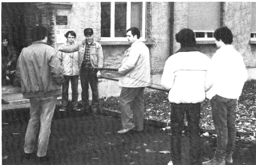
Prima il lavoro.

Altro avvenimento, ancora prima della Staffetta, sarà l'assemblea generale ordinaria, riunione alla quale attendiamo una massiccia partecipazione.