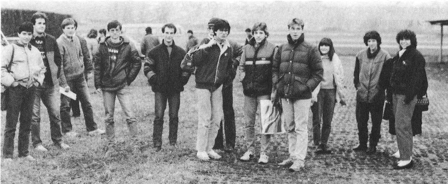
Entrata in servizio corso R902.