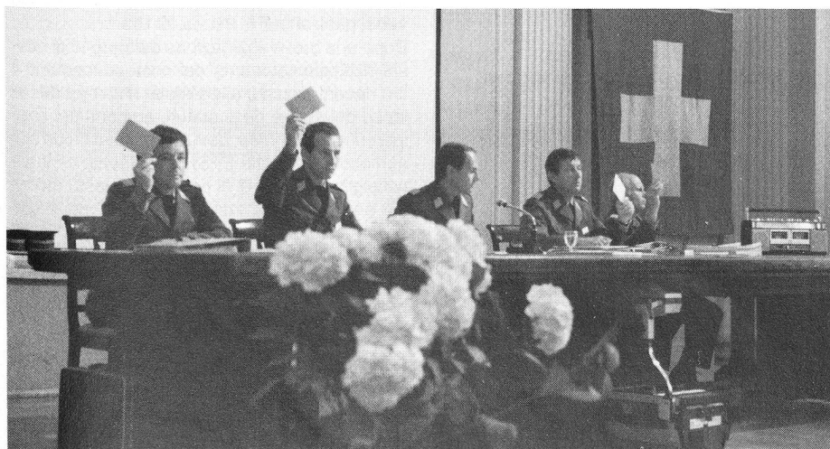
La sala della Sopracenerina dà ampio risalto alla 54 a assemblea generale. Il Comitato centrale si è prodigato con ogni mezzo pur di raggiungere i propri obiettivi; ha ottenuto i favori assembleari per il nuovo regolamento di tiro e per il sostegno del PIONIER. Doppio HURRÀ!

Alla richiesta da parte del presidente centrale se ci siano delle modifiche d'apportare all'ordine del giorno o al sistema di voto, i presenti rispondono negativamente.