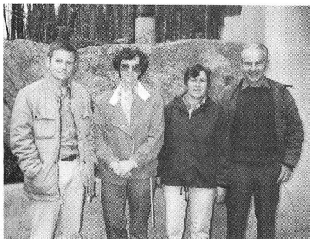
Das Siegerteam aus Winterthur

Konterfeis wurden dann am Ziel, wie in einer Galerie, aufgereiht, und jeder Fahrer musste sich mit möglichst wenigen Versuchen selber erkennen. Für den zweiten Teil des Postens fassten die Teilnehmer je ein «Stahlross». Mit diesem galt es, so rasch als möglich zum HG-Zielwurf und zurück zu radeln. Nach einem weiteren Posten, an dem mit einer Luftpistole möglichst viele Punkte erzielt werden sollten, erreichten die Teilnehmer das Waldhaus. Bevor sie allerdings zum Mittagessen an den Tisch sitzen konnten, mussten sie erst noch den Posten Kugelstossen absolvieren. Noch während des Essens konnten die ersten Zwischenranglisten bekanntgegeben werden. Die Computeranlage und das selbstgestrickte Programm des Obmannes erlaubten, nach jeder Postenarbeit sofort ein neues Zwischenklassement zu erstellen. Erwartungsgemäss war das Interesse daran sehr gross. Die Jagdmusik Hagglingen überraschte die Teilnehmer mit einem Ständchen. In ihrem grün-rot-gelben Jägersgewand bliesen sie zur Freude aller ihre Hörner und ernteten dafür einen dankbaren Applaus. Dann wurde die Sache allerdings wieder ernst. Ein Waldlehrpfad, als Verdauungsspaziergang nach dem Mittagessen gedacht, stand an der