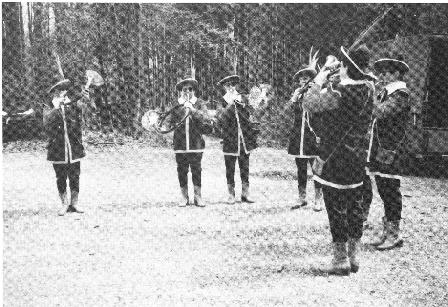
Die Jagdmusik Hagglingen beim Spiel

Danach erwartete die Fahrer ein Landrover. Landroverparcours, aufgestellte Büchsen, Zeitlimit und fahrerisches Können sind Stichworte über den ersten Teil. Während sich der Fahrer bemühte, keine Strafpunkte zu erhalten, musste der Beifahrer den Fahrer porträtieren. Die