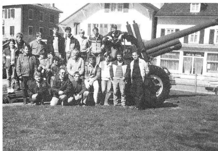
La traditionnelle «photo de famille» du dimanche à la fin de l'exercice.

Selon un protocole bien établi, ces jeunes ont effectué la traditionnelle course de patrouille à la carte dans la région de Longirod-Marchissy. La pratique de la boussole et de l'azimut dans le terrain n'est pas toujours évidente! Mais cette année, tout s'est très bien passé. Et la présence d'une SE-227 est rassurante.