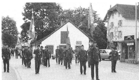
Tutti in fila

Durante i pasti e la festa «in famiglia» del sabato sera si è presentato un quadro bellissimo, dai colori giovani e vivaci, pieno di volontà ad incontrare il futuro.