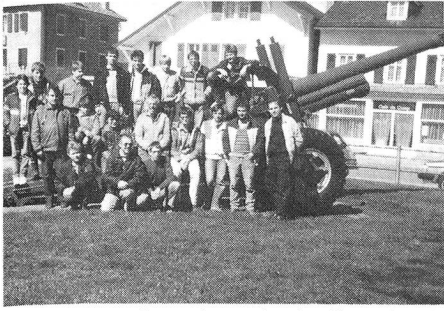
La traditionnelle «photo de famille» du dimanche à la fin de l'exercice.

Selon un protocole bien établi, ces jeunes ont effectué la traditionnelle course de patrouille à la carte dans la région de Longirod-Marchissy. La pratique de la boussole et de l'azimut dans le terrain n'est pas toujours évidente! Mais cette année, tout s'est très bien passé. Et la présence d'une SE-227 est rassurante.