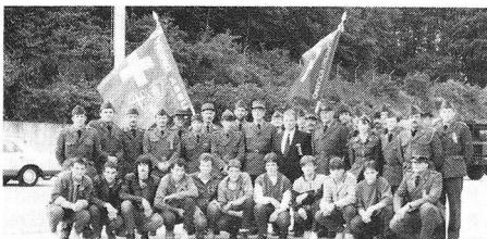
Siamo un'armata di pace, gioia, libertà

Sono sicuro che questi giovani hanno potuto usufruire delle esperienze vissute, le stesse approvate dai veterani che oggi guardano con soddisfazione ed un certo orgoglio questo «quadro».