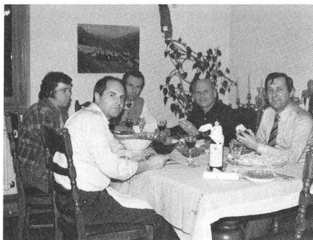
I membri del Comitato centrale si concedono un attimo di tregua per rifocillarsi.