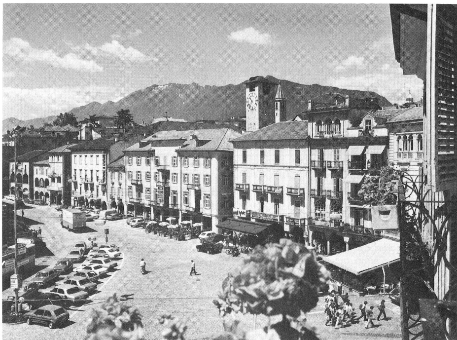
Locarno, sede della 54 a Assemblea generale

Possiamo anticipare che la 54 a Assemblea generale si terrà a Locarno. Per ragioni organizzative, ed in particolare di trasporto, essa si svolgerà sull'arco di due giorni secondo il seguente programma: