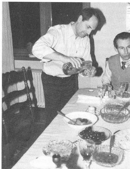
Il polso del Presidente è franco anche nella mescita.

E così chiacchierando un po' del pro e del contro, si trovano gli spunti per esporre alcune considerazioni e anticipazioni sulla nostra attività, che vi presentiamo in forma di «intervista al Presidente Centrale».