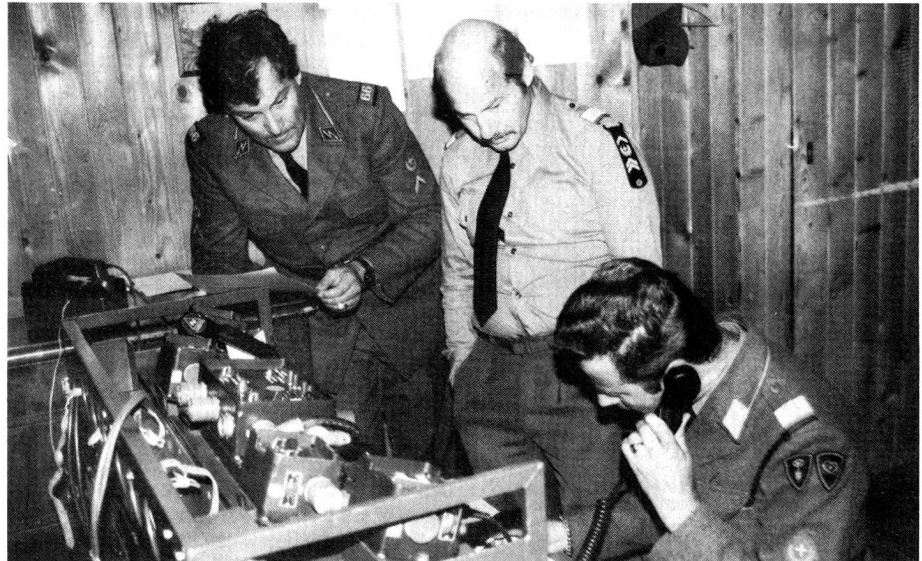
Führungsfunk im Einsatz