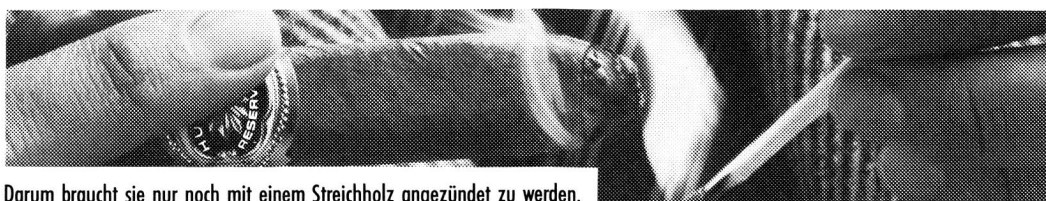
Darum braucht sie nur noch mit einem Streichholz angezündet zu werden.

Von einer Huifkar-Reservados getestet zu werden erfordert keine umfangreichen Vorkenntnisse und ist darum nicht besonders schwierig. Auch wenn Sie sich bis heute nur an Sonn- und Feiertagen oder aus reiner Abwechslung an eine Zigarre heranwagten. Alles, was Sie brauchen, um diesen einmaligen Test bei sich zu Hause, im Büro oder sonstwo erfolgreich zu bestehen, ist ein bisschen Fingerspitzengefühl für die oben dargestellten brenzlichen Situationen. Und natürlich eine leichte und aromatische Huifkar-Reservados, die wir Ihnen nach Erhalt Ihres Coupons gratis zustellen. Alles, was wir von Ihnen wissen möchten, ist, ob Ihnen die Huifkar-Reservados gefällt.