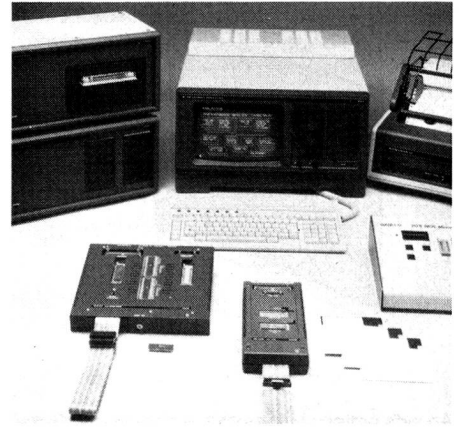
Philips-Entwicklungssystem-PMDS mit erweiterter Peripherie

Der modulare Schnell/Schönschreibdrucker PM 4492 ist mittels Kontrollsequenzen vollständig fernsteuerbar und verarbeitet auch Einzelblatt. Der universelle PROM-Programmer PM 4497 wird durch ein leistungsfähiges Low-costmodell (EP-408) ergänzt, das eine eigene Tastatur besitzt und auch ROM simulieren kann. Beide Programmer sind durch die PMDS-Software direkt unterstützt.