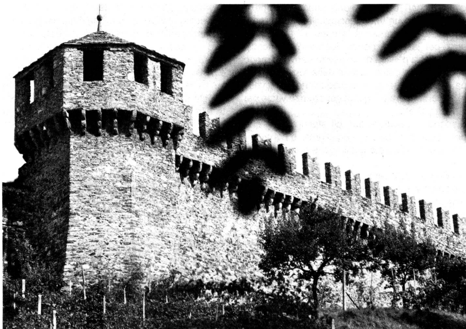
Das Schloss Schwyz oder Montebello aus der 2. Hälfte des 15. Jahrhunderts in Bellinzona. Le château de Montebello (seconde moitié du XV e siècle) à Bellinzona.