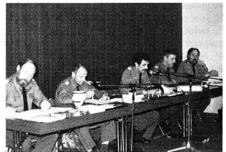
Le Comité central sortant (GL Genève)