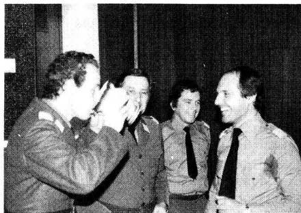
Le nouveau Comité central (GL Bellinzone)