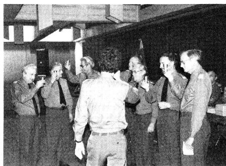
Nomination des vétérans (classe 1923)

Cette assemblée générale, le comité central a voulu l'organiser sur deux jours. Ce n'était évidemment pas la solution la plus facile, mais en entendant les échos et les avis de certains participants, on peut objectivement penser que ces deux jours furent une réussite.