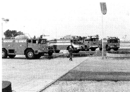
Démonstration du Service de sécurité de l'Aéroport de Genève-Cointrin