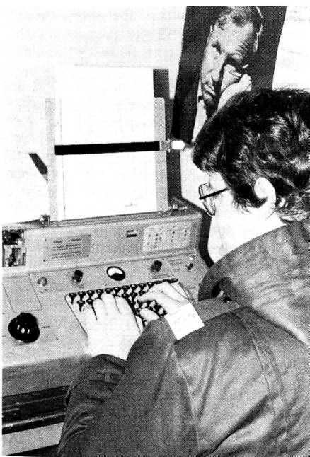
Ein Jungmitglied stellt auf dem Krypto-Funkferschreiber eine Verbindung zu einer andern Sektion her. Auf dem Manuskripthalter ist die Rufzeichenliste befestigt.

Nicht selten haben wir Verbindungen mit Bern, Neuenburg oder Thun, aber auch nähergelegene Sektionen wie Schaffhausen, Thurgau oder Uzwil sind unsere Partner.