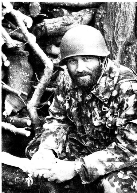
Mit Brieftauben können kleinste taktische Formationen einseitige Verbindung zu Meldesammelstellen aufrechterhalten.

Die Verwendungsmöglichkeit von Brieftauben für den militärischen Übermittlungsdienst beruht auf deren naturgebundenen Fähigkeit, von überall her wieder heimzufinden. Ausser handgeschriebenen Meldungen können diese auch Skizzen, Krokis, Filme oder andere leichte Gegenstände transportieren (Originalübermitt-