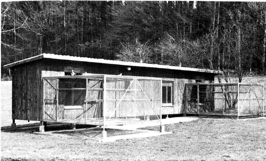
Fester Brieffaubenschlag im schweizerischen Mittelland.

– der Handhabung durch den Verbindungsbenützer mit minimaler Instruktion erbringen im Einsatz für die Bedürfnisse der terrestrischen Aufklärung und der Jagdkampf- und Kleinkriegsverbände den besten Nutzen. Brieffauben eignen sich hervorragend zur Entlastung von menschlichen Kurierverbindungen, und zwar als Träger kleiner Nachrichtenvolumen aus peripheren Gebieten in ein Zentrum. Brieffauben werden selbstverständlich nur während Funkstille, Funkunterbruch und Funkverbot eingesetzt, vor allem in Situationen, in welchen Drahtverbindungen nicht existieren, noch nicht erstellt oder unterbrochen worden sind. Da in unserem Lande die armeeeigenen Brieffaubenschläge und -bestände nicht ausreichen, besteht eine enge Zusammenarbeit zwischen der Armee und dem Zentralverband Schweiz. Brieffaubenzüchter-Vereine, wobei private Züchter der Armee ihre Tiere zur Verfügung stellen. Im Kriegsfall könnten auf diese Weise rund 40 000 Tauben eingesetzt werden. Die Schlagdichte im schweizerischen Mittelland erlaubt eine ausgiebige Benützung von Brieffauben. Im Voralpen-, Alpen- und Juragebiet befindet sich das Gros der leistungsfähigen armeeeigenen Brieffaubenschläge, welche den Bedürfnissen entsprechend platziert worden sind, und trotz der – verglichen mit dem Mittelland – geringen Schlagdichte ein ausgewogenes Verhältnis zwischen Mitteln und Kräften ergeben.