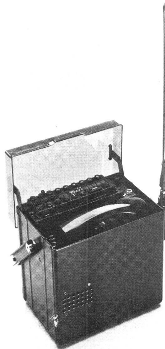
C-600-Maxicom: Traggehäuse für C-600-Serie.