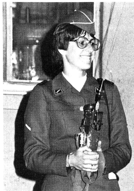
Les sections AFTT offrent des émetteurs récepteurs portatifs fiables, maniables sur des fréquences réservées. Elle met aussi des transmetteurs à disposition.

Depuis de nombreuses années les sections de l'AFTT sont utilisées pour les transmissions de manifestations: Fête de Genève, Fête des Ven-