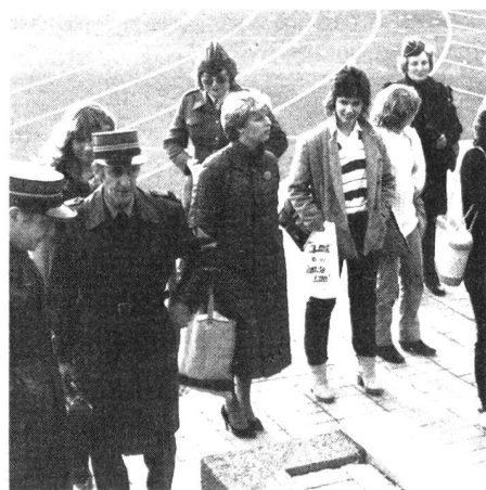
Recrutement terminé. Au prochain rassemblement on s'aligne.