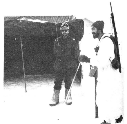
Sektion Bern: Einsatz mit SE-125

Seit dem 3. Februar 1982 ist das Basisnetz wieder auf Funkbereitschaft. Am 1. und 3. Mit-