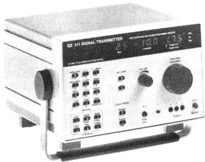
Générateur de signaux SZ 311