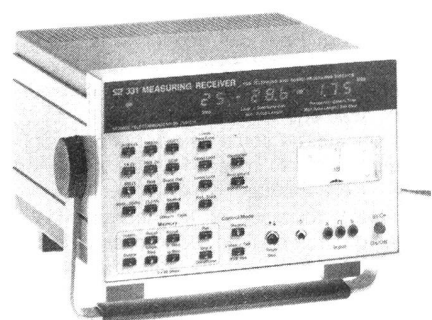
Récepteur de mesure SZ 331

En fonction des mesures à effectuer, les appareils SZ 311 et SZ 331 peuvent opérer de trois manières différentes: