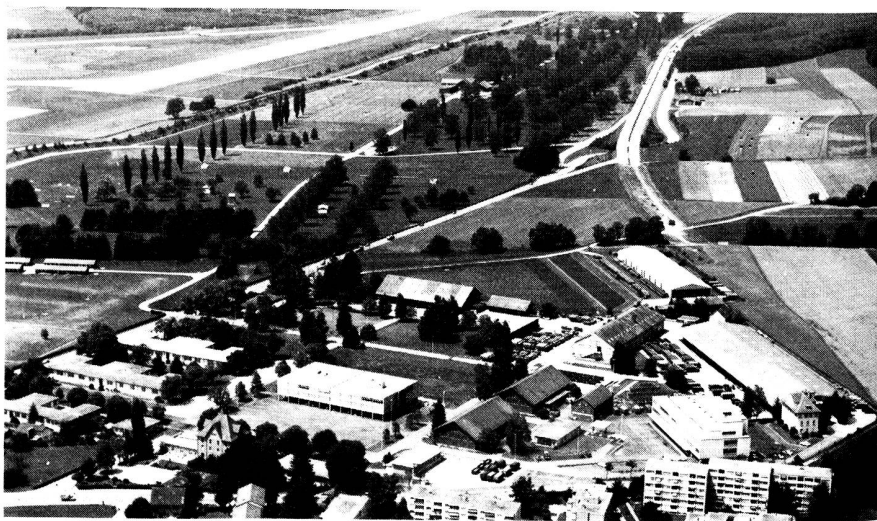
Waffenplatz Kloten von Südwesten

Wir danken den für den Waffenplatz Kloten-Bülach verantwortlichen Stellen für das während den vergangenen 70 Jahren aufrecht erhaltene, gute Einvernehmen und zählen weiterhin auf ein erspriessliches, freundschaftliches Zusammenleben mit unserem Waffenplatz! ●