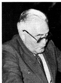
M. G.-A. Chevallaz

Votre organisation et votre association sont, dans leur particularité, l'exemple le plus prouvé