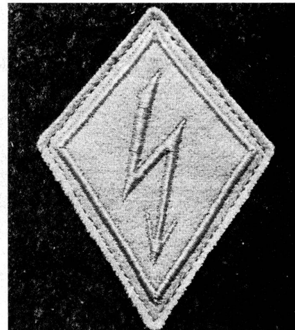
La couleur des parements est d'importance mineure.

Les liaisons par courriers et pigeons-voyageurs sont encore d'actualité. Les courriers sont engagés à tous les échelons de commandement. Il y a les courriers normaux et les courriers spéciaux qui sont utilisés suivant les besoins.