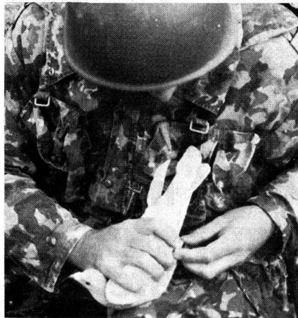
«Prise de liaison» avec pigeons-voyageurs.

Le choix de parcours sûrs et la sécurité des courriers est d'une très grande importance. Les caractéristiques des pigeons voyageurs sont particulièrement mises en exergue lors de l'engagement dans le cadre de l'exploitation, du combat de chasse et de la guérilla. Chaque commandant tactique porte la responsabilité du service de transmission dans sa sphère de commandement. Des points renforcés peuvent être créés pour répondre aux objectifs du chef tactique ou opérationnel. Les efforts en matière de liaison sont réalisés par la superposition de divers moyens de transmission, par exemple par la conduite multiple de liaisons et par l'engagement de moyens particulièrement efficaces. Chaque organe de commandement prend, dans sa zone, les mesures de protection électroniques nécessaires.