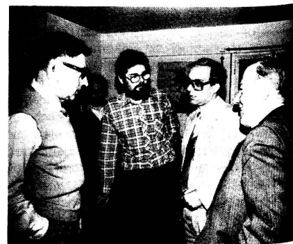
Die «alten Füchse» beim Fachsimpeln

Eine «Nachmittags-Idee» wurde durch das Ausarbeiten eines Drehbuches über das Thema «Funk» verwirklicht. Das Abenteuer begann in den frühen Morgenstunden (bei Mineralwasser und Kerzenlicht, versteht sich), als ich den Technischen Leiter des KRS (Kabelfernsehen der Region Solothurn) überzeugen konnte, dass wir einen Werbefilm über den EVU (respektive Funk) im allgemeinen ausstrahlen sollten. Zu meinem Erstaunen war er einverstanden, und so begann die nervenaufreibende Arbeit hinter und vor der surrenden Kamera. Als die Detailarbeiten soweit fortgeschritten waren, kam der grosse Augenblick der Aufnahmen. Gespannt warteten wir auf das Team mit den Scheinwerfern, Kameras, Kabel,