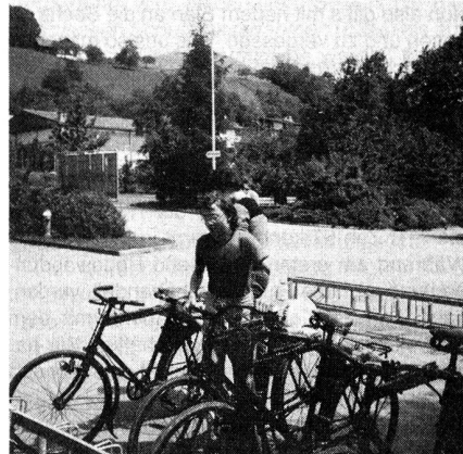
Das neue Übermittlungsmaterial, getestet in der Übung

Bei der Übungsbesprechung zeigten sich der Übungsleiter wie auch die Übungsinspektoren mit dem Einsatz und den gebotenen Leistungen zufrieden.