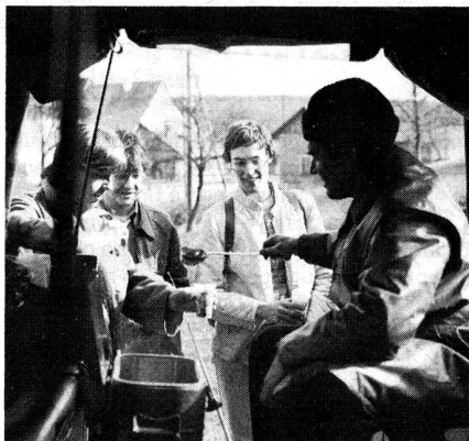
Ein Teeposten unterwegs