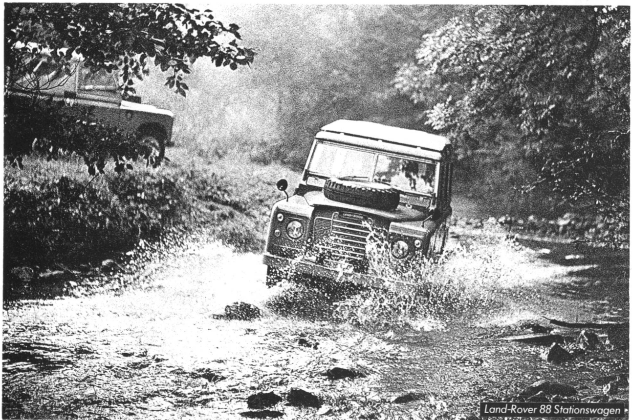
Land-Rover 88 Stationswagen