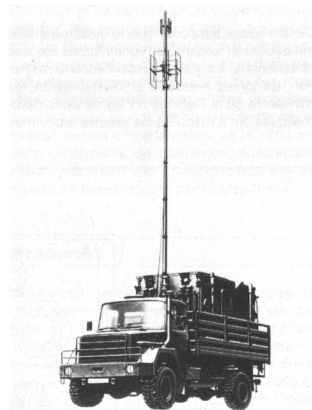
Mit diesem mobilen Peiler für Ultrakurzwellen können auf grössere Distanzen gegnerische Sender geortet werden.

Abschliessend muss unbedingt erwähnt werden, dass unter bestimmten Umständen Kernexplosionen die Eigenschaften der Ionosphäre (eine einige hundert Kilometer über dem Erdboden liegende Schicht der Erdatmosphäre) in einem begrenzten Bereich verändern können. Das hat Bedeutung für die weltweite Kommunikation über Kurzwellen . Man muss annehmen, dass dabei Kurzwellenverbindungen empfindlich gestört oder für einige Zeit sogar gänzlich unterdrückt werden – eine auch im Zeitalter der Satellitentechnik gravierende Wirkung.