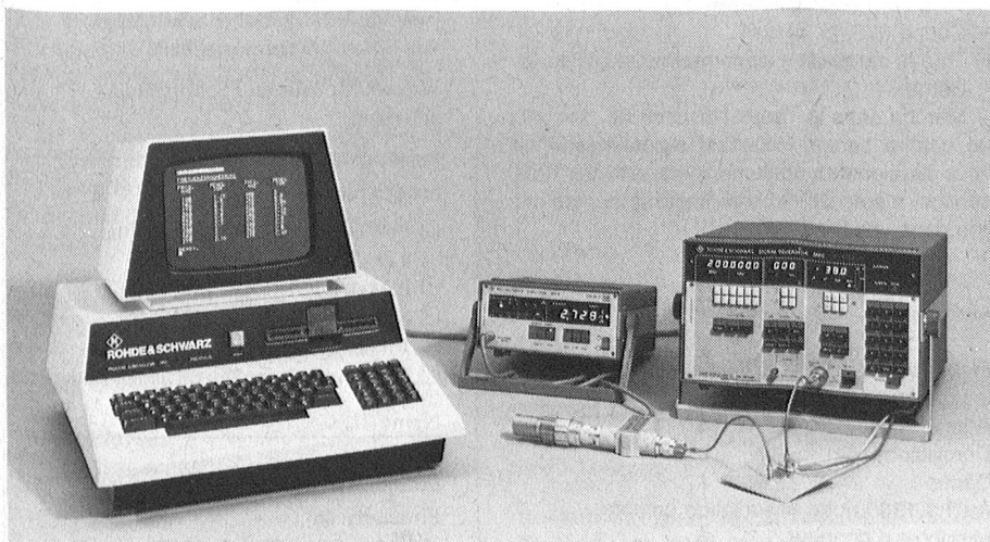
Der Process Controller PPC von Rohde & Schwarz ist ein Tischrechner, der alle Eigenschaften aufweist, die für normgerechte IEC-Bus-Steuerung sowie für schnelle und bequeme Bedienung erforderlich sind.