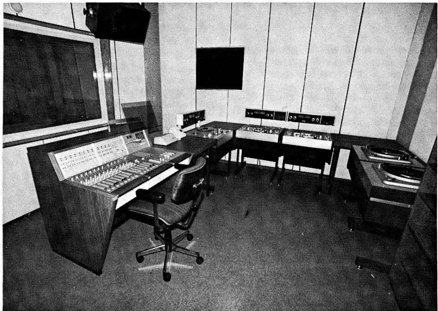
Bild 3: Programmregie 3 Jeddah Broadcasting, Saudi-Arabien

Mit diesen beiden Grossprojekten hat die Firma STUDER einen weiteren mutigen Schritt unternommen. Solche Projekte verlangen eine genaue Koordination. Weitere Projekte dieser Art sind zurzeit im Offertstadium. Bereits in dieser Phase muss sehr genau darauf geachtet werden, dass lückenlose Arbeit geleistet wird. Ist der Vertrag einmal unterzeichnet, können keine preislichen Änderungen mehr vorgenommen werden. Was bei der Offerte an Teilen oder gar Geräten vergessen wurde, geht zu Lasten der Firma. Der Kunde ist meistens nicht in der Lage, eine derart umfangreiche Offerte, welche oft mehrere Ordner umfasst, in allen Einzelheiten auf Vollständigkeit hin zu prüfen. Meistens entbindet sich der Kunde mit einem einfachen Satz in der Ausschreibung von allen Verantwortungen hinsichtlich der Vollständigkeit der Ausschreibung. Ein solcher Satz kann zum Beispiel lauten: «Der Lieferant ist verantwortlich, alle notwendigen Geräte und Teile mitanzubieten, welche in der Ausschreibung nicht erwähnt wurden, jedoch für die einwandfreie Funktion nötig sind».