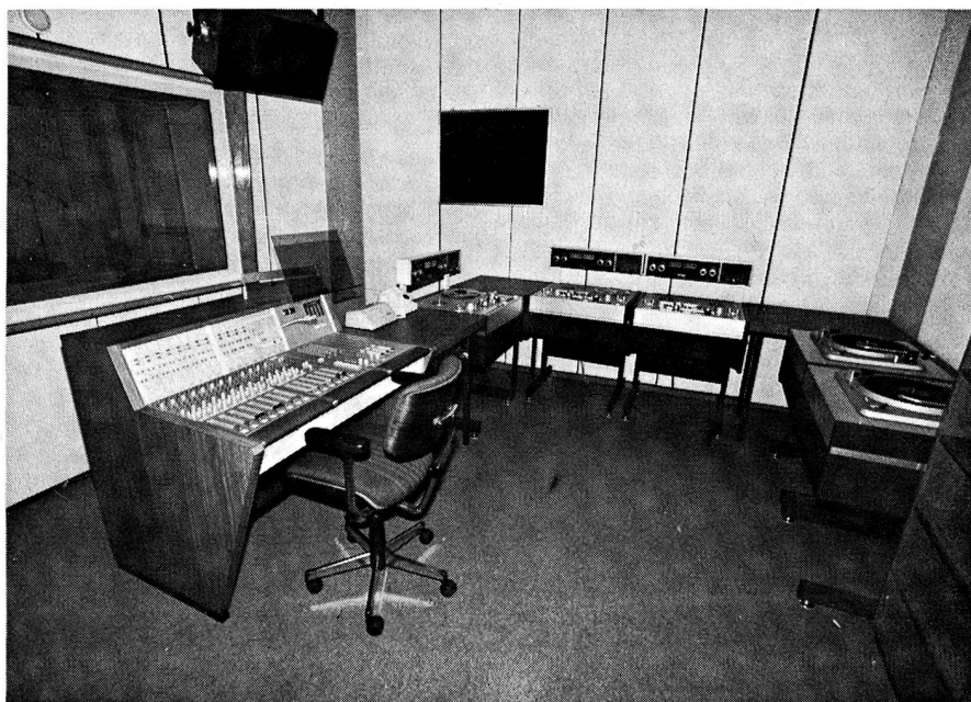
Bild 3: Programmregie 3 Jeddah Broadcasting, Saudi-Arabien

Mit diesen beiden Grossprojekten hat die Firma STUDER einen weiteren mutigen Schritt unternommen. Solche Projekte verlangen eine genaue Koordination. Weitere Projekte dieser Art sind zurzeit im Offertstadium. Bereits in dieser Phase muss sehr genau darauf geachtet werden, dass lückenlose Arbeit geleistet wird. Ist der Vertrag einmal unterzeichnet, können keine preislichen Änderungen mehr vorgenommen werden. Was bei der Offerte an Teilen oder gar Geräten vergessen wurde, geht zu Lasten der Firma. Der Kunde ist meistens nicht in der Lage, eine derart umfangreiche Offerte, welche oft mehrere Ordner umfasst, in allen Einzelheiten auf Vollständigkeit hin zu prüfen. Meistens entbindet sich der Kunde mit einem einfachen Satz in der Ausschreibung von allen Verantwortungen hinsichtlich der Vollständigkeit der Ausschreibung. Ein solcher Satz kann zum Beispiel lauten: «Der Lieferant ist verantwortlich, alle notwendigen Geräte und Teile mitanzubieten, welche in der Ausschreibung nicht erwähnt wurden, jedoch für die einwandfreie Funktion nötig sind».