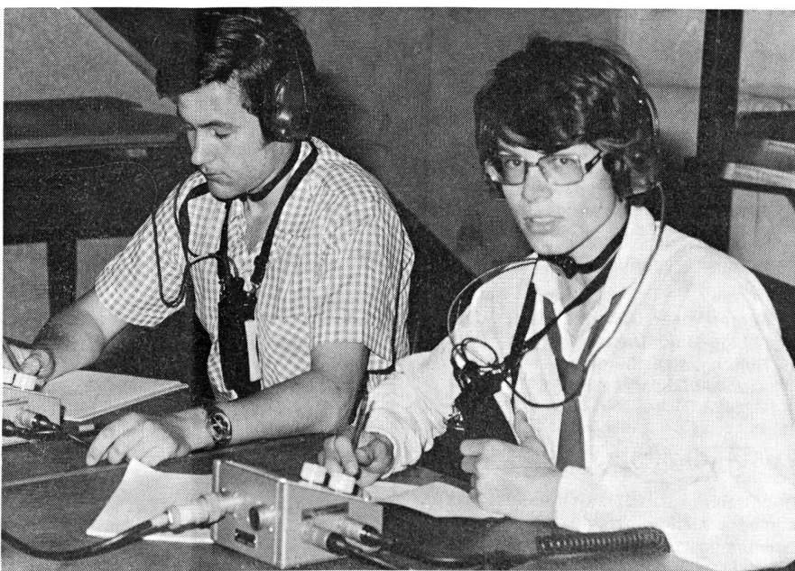
La garniture de conversation 71 permet un entraînement efficace des règles de trafic en phonie pour les participants au cours C.

Während die Morsekurse für zukünftige Funkerpioniere und die Sprechfunkkurse für Uebermittlungssoldaten oder Funkerpioniere konzipiert sind, bereiten die Fernschreibkurse auf die Rekrutenschule als Betriebspionier vor. Unser Bild zeigt zwei Betriebspioniere am Fernschreiber Stg-100.