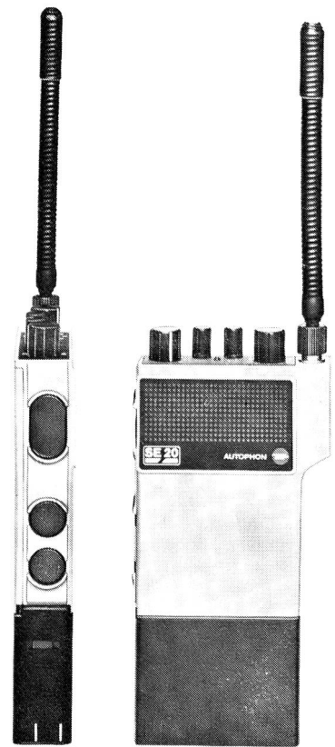
SE-20 von Autophon: Mit seinen Leistungsdaten zur Zeit das kleinste professionelle Handsprechfunkgerät

entsprechend ist der Aufbau und die Ausführung der SE-20-Geräte den hohen Anforderungen der anvisierten Benutzer angepasst. Dies erkennt man dann auch an der robusten mechanischen Ausführung der Geräte, die ein Ganz-Metall-Gehäuse aufweisen, der Ausführung der Bedienelemente und an den hervorragenden technischen Daten.