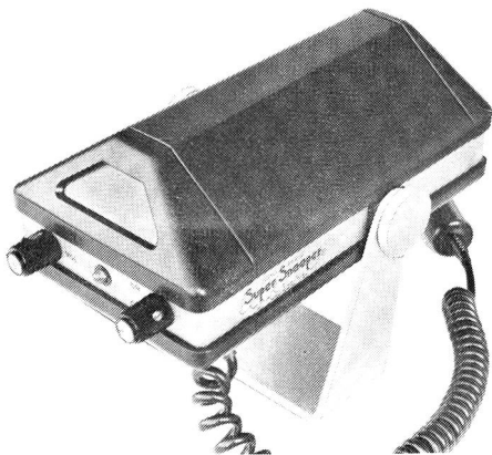
Radarwarngerät «Super Snooper»

für deren Betrieb die Polizei von der PTT eine spezielle Konzession erhält. Es wird weiter festgestellt, dass das Radarwarngerät eine hochempfindliche radioelektrische Empfangsanlage sei, die die vom Messgerät der Polizei ausgestrahlten Wellen aufnimmt und sie in akustische und optische Signale umwandelt. Dadurch wird der Fahrzeuglenker auf die bevorstehende Geschwindigkeitskontrolle aufmerksam gemacht. Das Radarwarngerät stellt daher eine radioelektrische Empfangsanlage dar, deren Erstellen und Betrieb unter das Fernmelderegale des Bundes fällt und einer Konzession der PTT bedarf. Für den Betrieb von Radarwarngeräten werden durch die PTT-Betriebe jedoch keine Konzessionen erteilt. Der Betrieb eines Radarwarngerätes ist somit eine Widerhandlung gegen das Bundesgesetz betreffend den Telegraf- und Telefonverkehr (TVG).