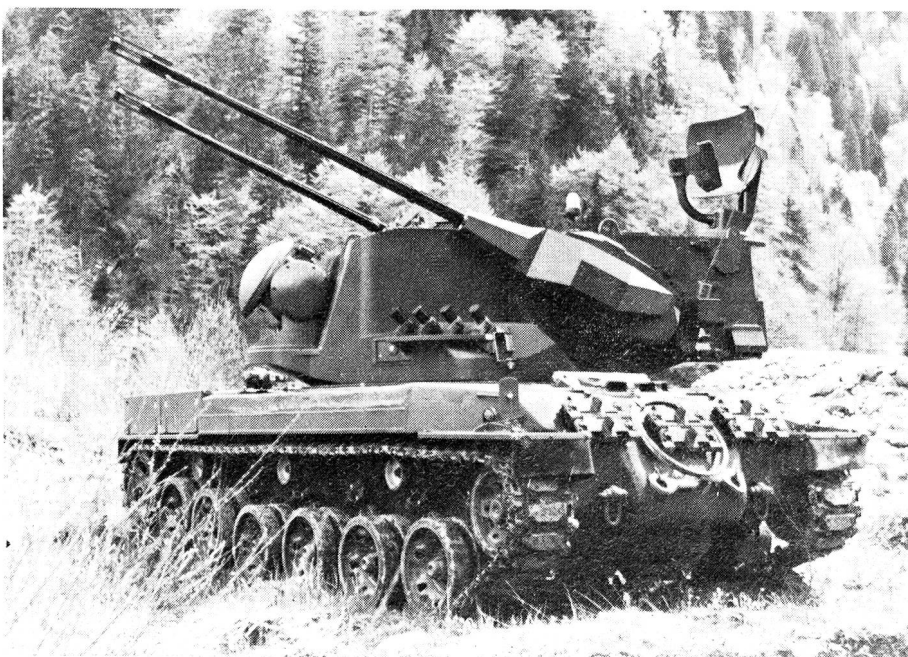
35 mm Flabpanzer Oerlikon-Contraves mit Fahrgestell des Schweizer Panzers 68

Dieses autonome und mobile Fliegerabwehrsystem wird unter anderem mit zwei 35 mm Oerlikon-Fliegerabwehrkanonen, einer Contraves-Feuerleitanlage sowie mit Siemens bzw. Siemens-Albis Radargeräten ausgerüstet sein.