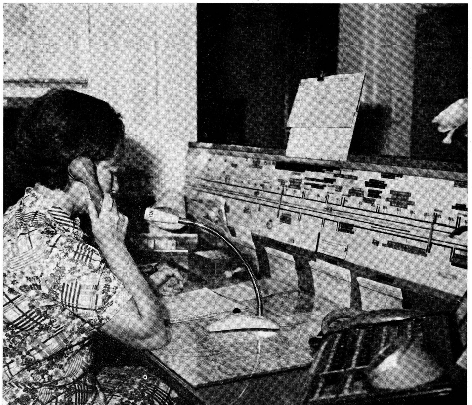
Auf der Pannenhilfezentrale ist die Telefonistin die Weichenstellerin. Sie ist dafür verantwortlich, dass der rechte Mann an den rechten Ort geschickt wird.

Während ihrer Arbeitszeit befinden sich die Patrouilleure auf den Strassen ihrer Region