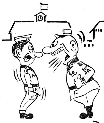
«Woran erkennt man einen Feldweibel?» — «Am Gebrüll, Feldweibel!»

Der nächste Schritt bestand in der Untersuchung und Gewichtung unserer militärischen Ausbaubedürfnisse in allen Bereichen einschliesslich der Luftverteidigung. Namentlich mussten Rolle und Aufgabe der Flugwaffe und der Fliegerabwehr definiert, ausgedehnt und die Planungsmittel entsprechend verteilt werden. Diese Vorarbeiten erlaubten es dem EMD in der Folge, dem Bundesrat die Grundla-